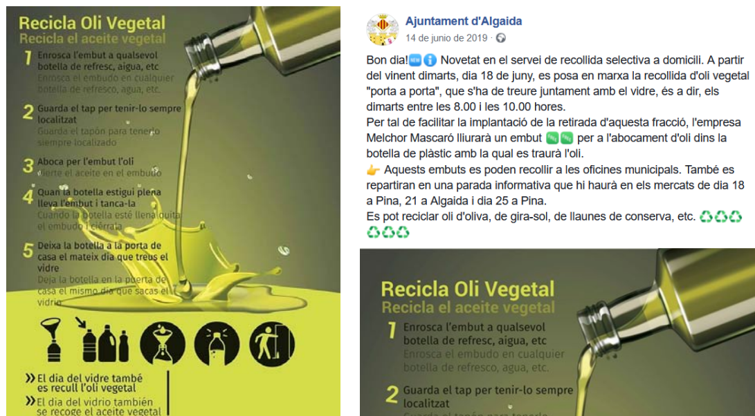
Figura 4. Cartel informativo sobre el funcionamiento del proceso de almacenamiento y recogida del aceite vegetal usado (izquierda) y mensaje informativo publicado en las redes sociales por el Ayuntamiento de Algaida (derecha).

Paralelamente los ayuntamientos también han publicado, desde la implantación del sistema, mensajes de tipo informativo a través de sus redes sociales.