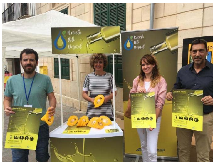
Figura 3. Parada informativa en el municipio de Montuïri (arriba) y en Porreres (abajo) en el marco de la puesta en marcha de la recogida puerta a puerta de aceite vegetal doméstico.