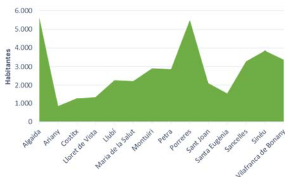
Figura 1. Localización de los municipios que conforman la Mancomunitat del Pla de Mallorca (izquierda) y número de habitantes de los municipios que la forman (derecha).

Esta recogida se realiza de manera coordinada con la recogida de envases de vidrio, dado que el sistema de recogida puerta a puerta está fuertemente arraigado en los municipios que forman parte de la mancomunidad, ya que desde finales de 2007 cuentan con un sistema de recogida selectiva puerta a puerta para las siguientes fracciones de residuos: materia orgánica, envases ligeros, papel y cartón, envases de vidrio, rechazo y voluminosos.