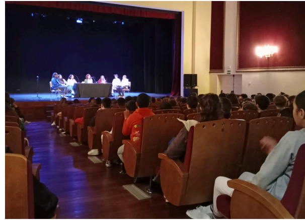
Evidències de la conferència (25N) i d'una de les taules rodones a Porreres (8M)

Cal esmentar que, a més de la població destinatària directa ja reflectida anteriorment, estem davant una campanya que té com a públic diana la població general de Mancomunitat Pla de Mallorca. Segons estimacions del cens poblacional, podem arribar a un abast de 39.967 persones residents.