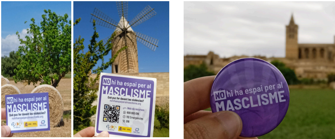
Evidències d'alguns materials sensibilitzadors del període 21-22 i 22-23.