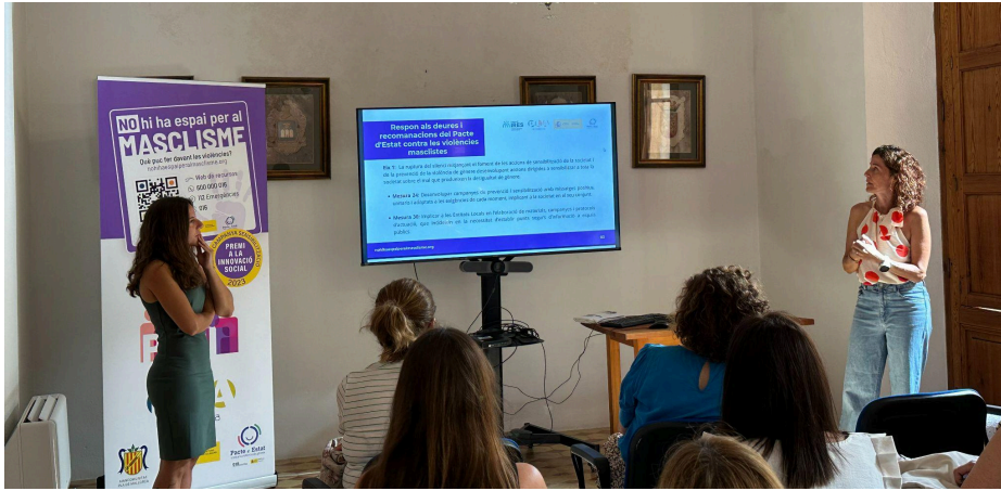
Imatge de la roda de premsa de 2024.