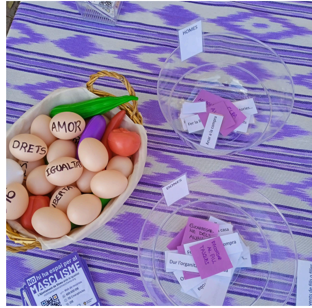
Evidències d'algunes activitats del Punt Lila: No hi ha espai per al masclisme.

Per a la realització d'aquestes accions, es compta amb la participació d'una persona voluntària (dona àrab que col·labora amb la intermediació amb dones àrabs) i una alumna en pràctiques (promoció de la igualtat de gènere).