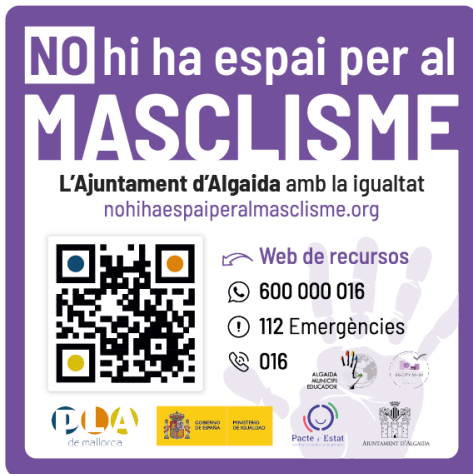
Exemple de ferratina del municipi d'Algaida