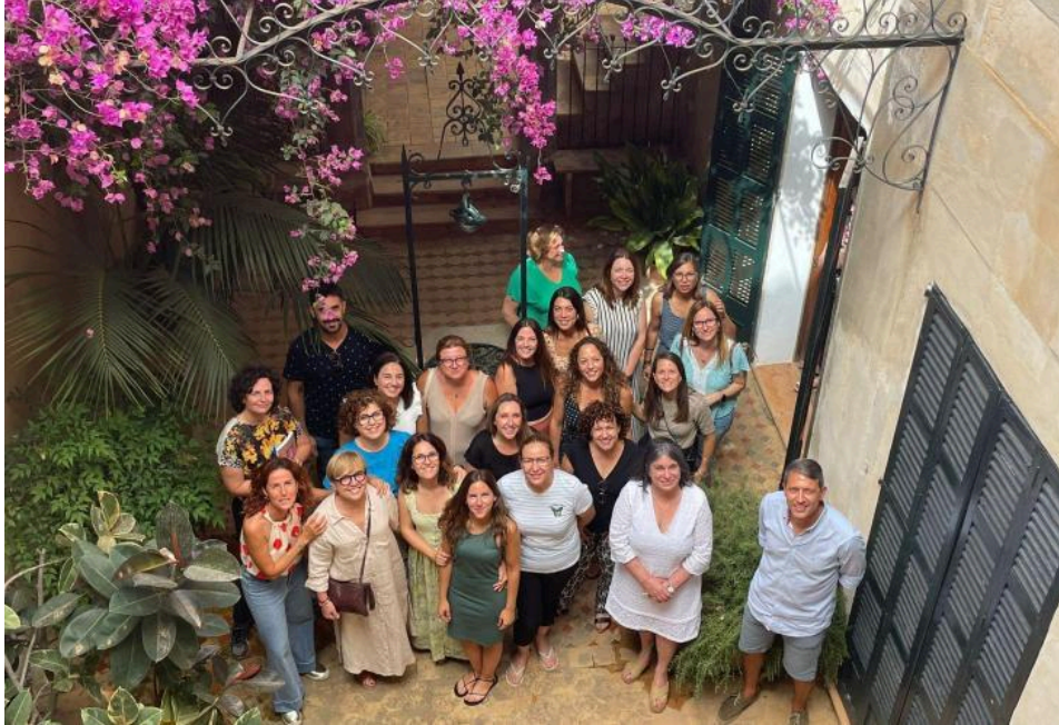
Imatge de la roda de premsa de la campanya 2023-24

Mancomunitat Pla de Mallorca, Fundació IRES, equips tècnics dels ajuntaments, entre altres agents implicats.